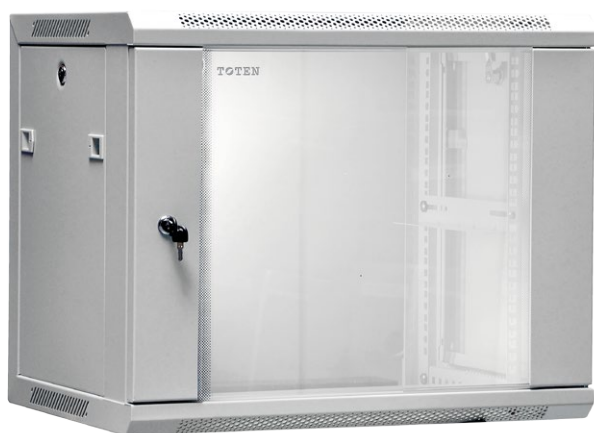
Szafa wisząca jednosekcyjna 19" 9U; 450/600; kod: W.9U.450.cz.

Seria szaf W to szafy wiszące jednosekcyjne , wewnątrzbudynkowe o głębokości 450 mm lub 600 mm . Lekka, spawana konstrukcja pozwala na łatwy montaż naścienny dzięki specjalnemu profilowi, do którego mocowana jest szafa. Szafy te idealnie sprawdzają się jako proste rozwiązanie dla małych instalacji sieciowych, alarmowych czy audio-wideo. Obciążenie statyczne do 60 kg pozwala instalować urządzenia UPS, rejestratory czy małe serwery. Wszystkie szafy wyposażone w zdejmowane boki i dwa zamki 1-punktowe, co stanowi znaczne ułatwienie dla instalatora. Szeroki zakres wysokości szaf od 4U do 27U pozwala na precyzyjny dobór modelu do potrzeb instalowanego sprzętu.