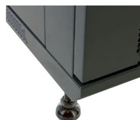
Szafa na nóżkach (opcjonalnie)