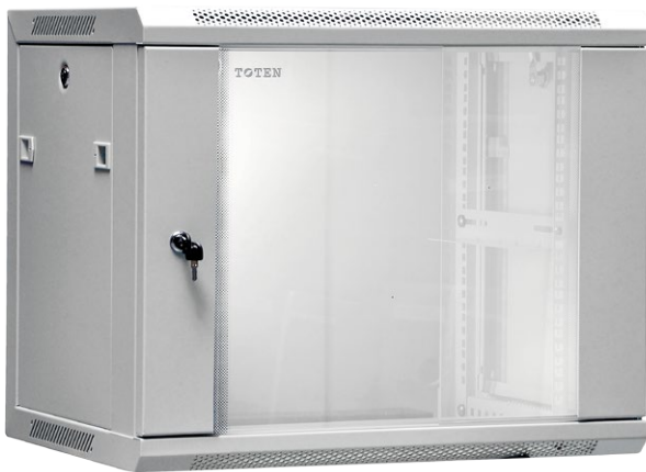
Szafa wisząca jednosekcyjna 19" 9U; 450/600; kod: W.9U.450.cz.

Seria szaf W to szafy wiszące jednosekcyjne , wewnątrzbudynkowe o głębokości 450 mm lub 600 mm . Lekka, spawana konstrukcja pozwala na łatwy montaż naścienny dzięki specjalnemu profilowi, do którego mocowana jest szafa. Szafy te idealnie sprawdzają się jako proste rozwiązanie dla małych instalacji sieciowych, alarmowych czy audio-wideo. Obciążenie statyczne do 60 kg pozwala instalować urządzenia UPS, rejestratory czy małe serwery. Wszystkie szafy wyposażone w zdejmowane boki i dwa zamki 1-punktowe, co stanowi znaczne ułatwienie dla instalatora. Szeroki zakres wysokości szaf od 4U do 27U pozwala na precyzyjny dobór modelu do potrzeb instalowanego sprzętu.