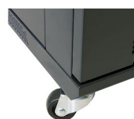
Szafa na kółkach (opcjonalnie)