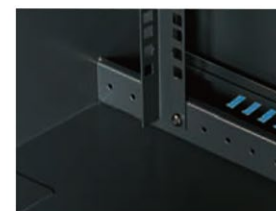
2 pary profili montażowych