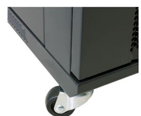
Szafa na kółkach (opcjonalnie)