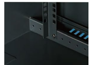
2 pary profili montażowych