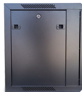
Szafa wisząca jednosekcyjna 19" 9U; 600/600; kod: W.9U.600.cz