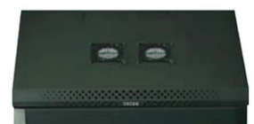
2 wentylatory 120mm (opcjonalnie)