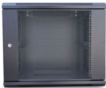
Szafa wisząca jednosekcyjna 19" 9U; 450/600; kod: W.9U.450.cz