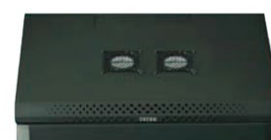
2 wentylatory 120mm (opcjonalnie)