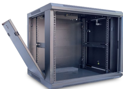
Szafa wisząca jednosekcyjna 19" 9U; 600/600; kod: W.9U.600.cz