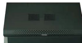
Szafa bez wentylatorów (standardowa)

Seria szaf W to szafy wiszące jednosekcyjne , wewnątrzbudynkowe o głębokości 450 mm lub 600 mm . Lekka, spawana konstrukcja pozwala na łatwy montaż naścienny dzięki specjalnemu profilowi, do którego mocowana jest szafa. Szafy te idealnie sprawdzają się jako proste rozwiązanie dla małych instalacji sieciowych, alarmowych czy audio-wideo. Obciążenie statyczne do 60 kg pozwala instalować urządzenia UPS, rejestratory czy małe serwery. Wszystkie szafy wyposażone w zdejmowane boki i dwa zamki 1-punktowe, co stanowi znaczne ułatwienie dla instalatora. Szeroki zakres wysokości szaf od 4U do 27U pozwala na precyzyjny dobór modelu do potrzeb instalowanego sprzętu.